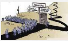
Forvæntingur um at projekt er lineat Góðvarin trúgv uppá at einki broystit